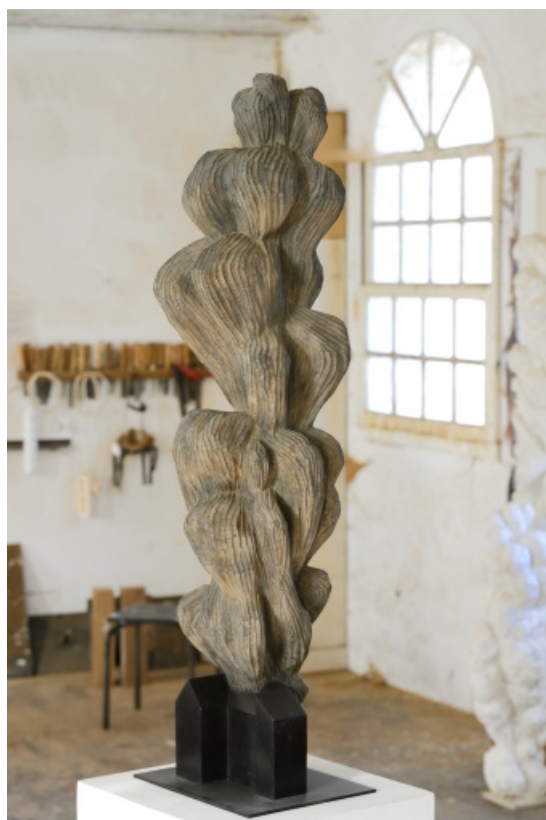
Maison et Volute , bronze, 2012