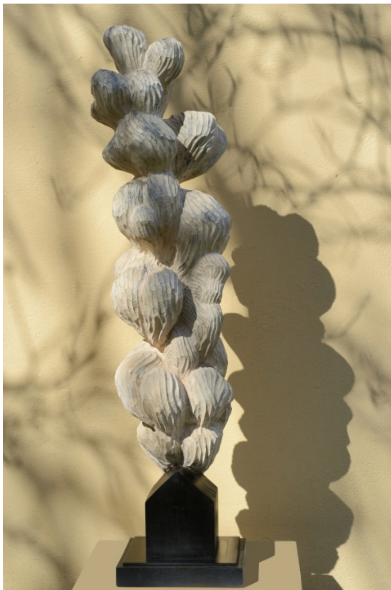
Cabane et volutes , bois, 97 cm