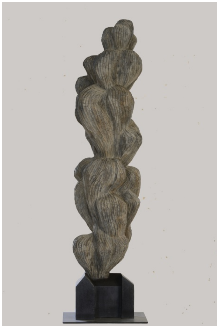
Maison et Volute , bronze, 2012