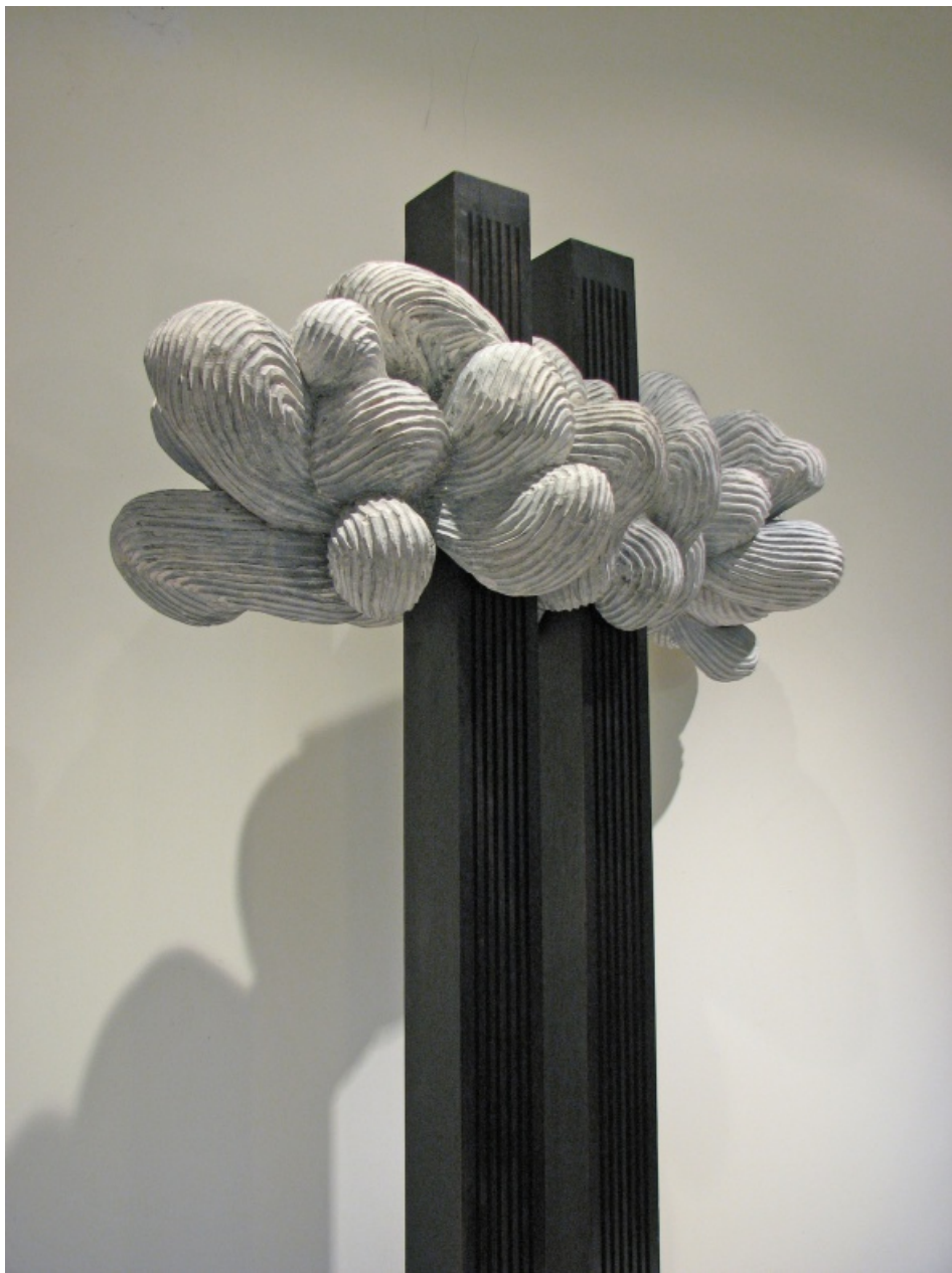
Cloud , bois, 120 cm