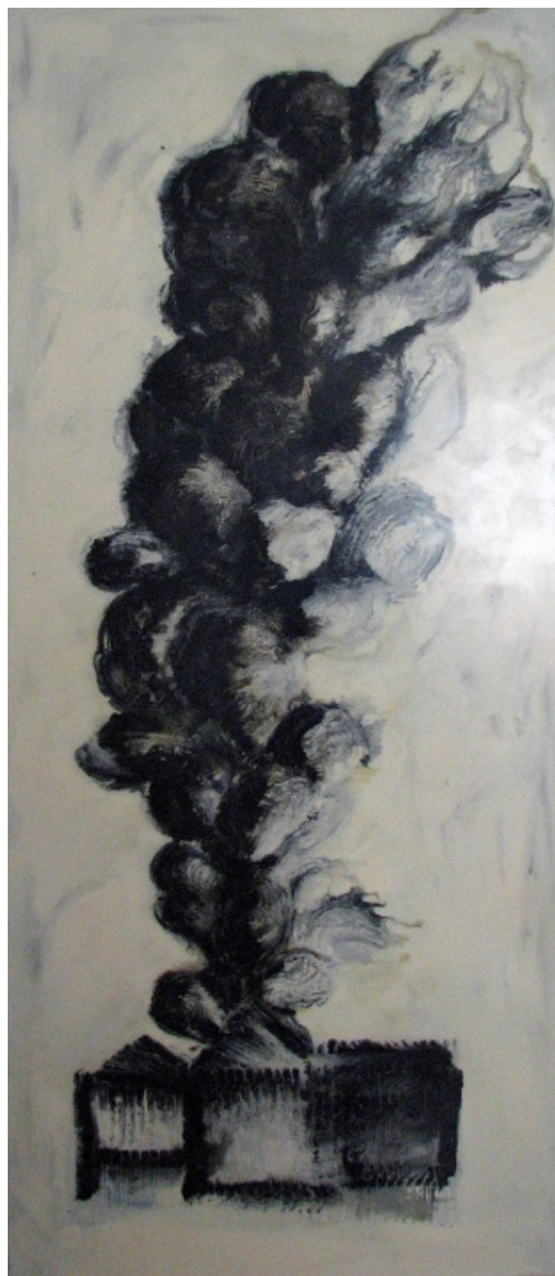
Maison et fumée , 2012, 180 x 73 cm